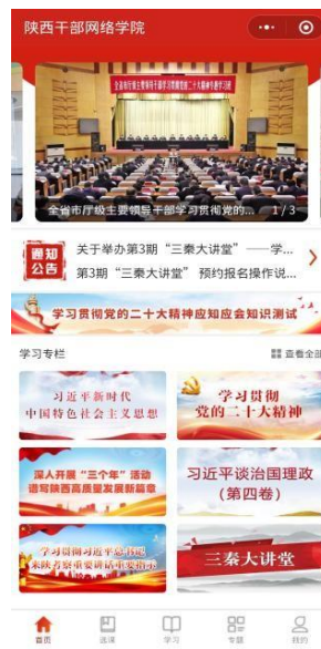
(移动学习登录窗口)

登录成功后在平台右上角可以修改登录密码。再次登录时，学员可以用手机号和密码的方式登录。